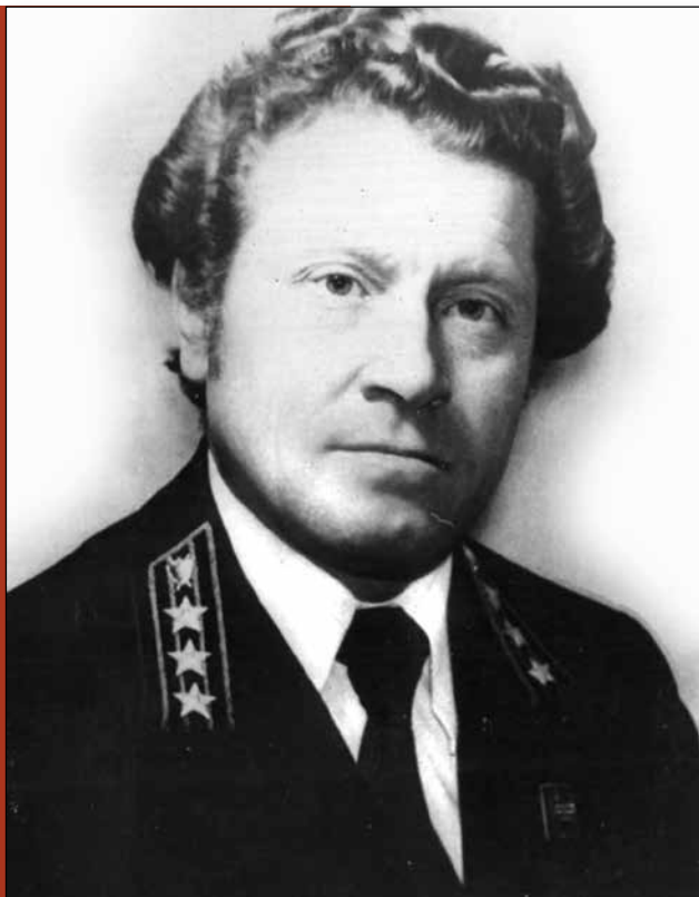
Сфотографирован в период работы прокурором округа. 1978 г.

На проходивших совещаниях я старался записать тезисы выступлений, задачи, которые ставила вышестоящая прокуратура. По возвращении собирал работников аппарата, прокуратур Салехарда, Лабитнанги, в отдельных случаях и всех сотрудников прокуратур, сообщал о сути состоявшихся совещаний, кто выступал, какие обсуждались вопросы и какие приняты решения, что необ-