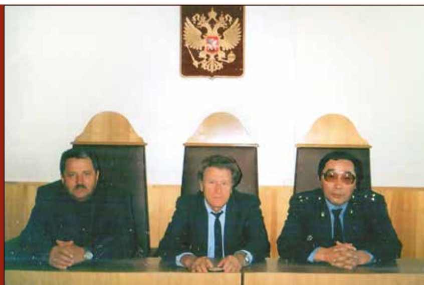
В Красноселькупе через 40 лет. Встреча с прокурором района и судьей.